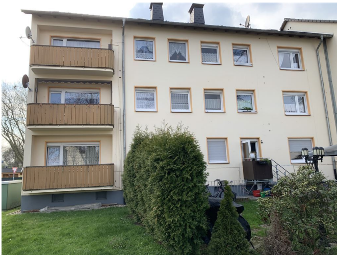
Ansicht Haus 1

Kaufpreis: 1.900.000,00 € Wohnfläche (ca.): 1.092,00 m 2 Grundstücksfläche (ca.): 1.881,00 m 2 Zimmer: 54