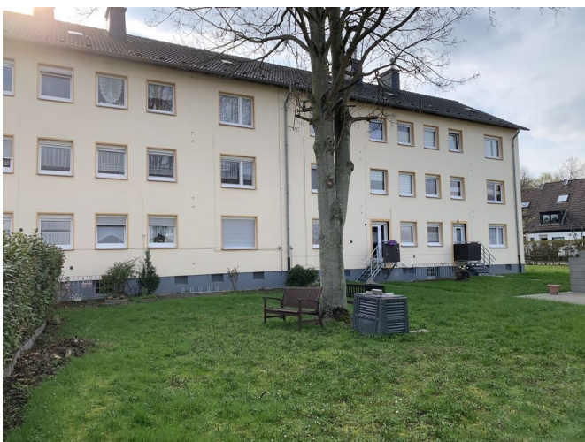
Ansicht Haus 3