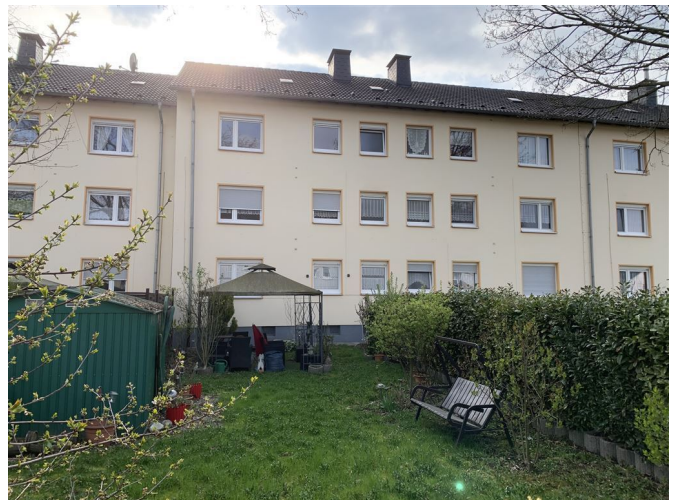
Ansicht Haus 2