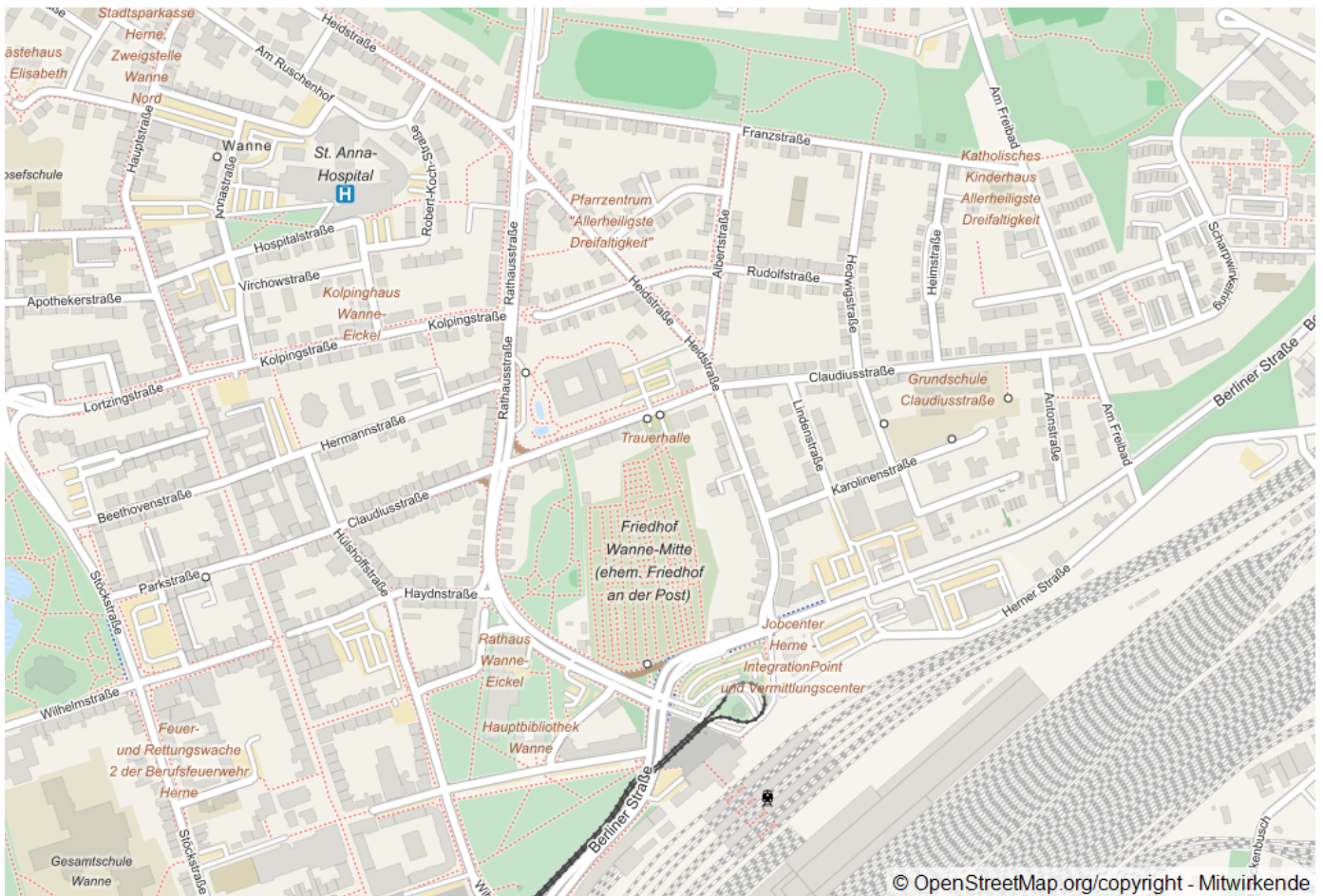
C, 44649 Herne , Westf

Kaufpreis: 116.200,00 € Wohnfläche (ca.): 83,00 m 2 Zimmer: 3